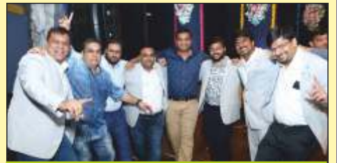
ઘાટકોપર યુવક મંડળ કમિટી