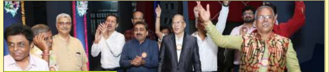
રંગ કસુંબલ ગુજરાતનો આનંદ માણતા