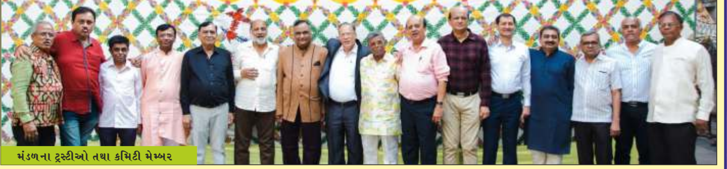
મંડળના ટ્રસ્ટીઓ તથા કમિટી મેમ્બર