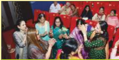
રંગ કસુંબલ ગુજરાતનો આનંદ માણતા