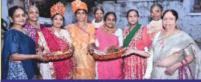
આરાધક બહેનો શ્રી પ્રભુજીની જિનાલય ઉપકરણ છાંય સાથે