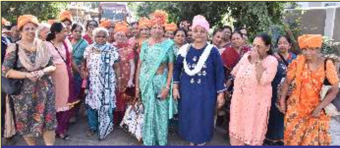
સર્વે આરાધક બહેનોનું સામૈયું