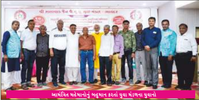
આમંત્રિત મહેમાનોનું બહુમાન કરતાં યુવા મંડળના યુવાનો