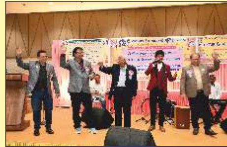
મ્યુઝિકલ પ્રોગ્રામની મજા માણતા કારોબારી સભ્યો