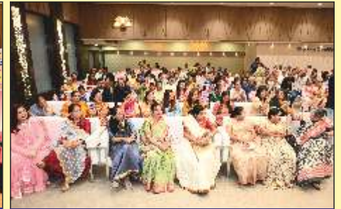
પ્રોગ્રામની વિશિષ્ટ ક્ષણોને વાગોળતા મંડળનાં સભ્યો