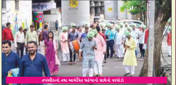
તપસ્વીરત્નો તથા આમંત્રિત મહેમાનો સાથેનો વરઘોડો