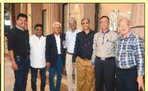
સંઘના કારોગારી અને પરામંડળના કારોગારી સભ્યો