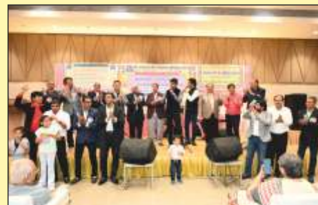
મ્યુઝિકલ પ્રોગ્રામનો મંડળનાં કમીટી મેમ્બરો તથા શુલક મંડળના મેમ્બરો