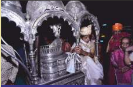
શ્રી જપ તળેટીની શોભાયાત્રામાં રથમાં માતૃશ્રી શારદાબેન