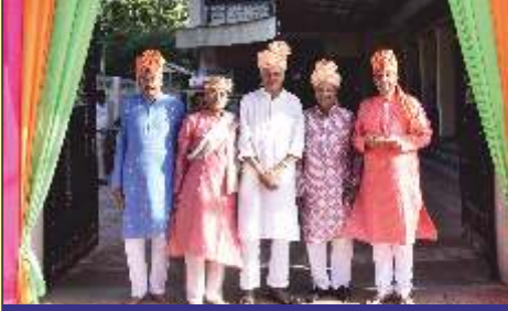
સ્વાગત : લાભાર્થી શ્રી હર્ષદભાઈ સાથે હોદેદારો