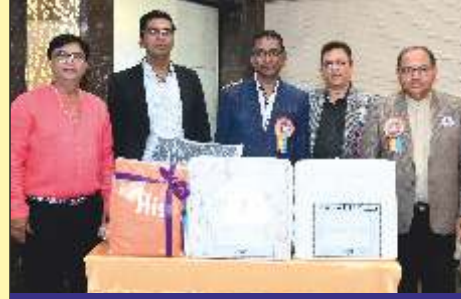
સ્પેશલ લક્ષ્મી ડ્રો પ્રાઈઝ સાથે કમીટી મેમ્બરો