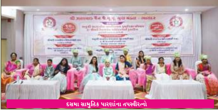
દસમા સામુહિક પારણાના તપસ્વીરત્નો