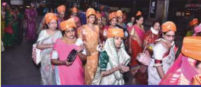
શોભાયાત્રામાં આરાધક બહેનો