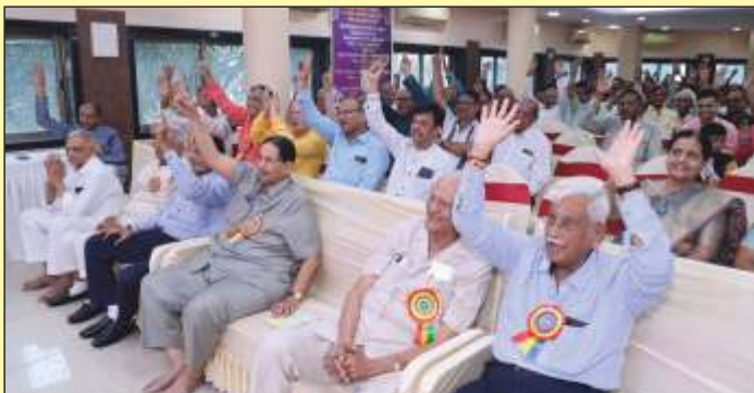
ભકિતરસમાં લીન પ્રમુખશ્રી, ટ્રસ્ટીશ્રી, હોદ્દેદારો.