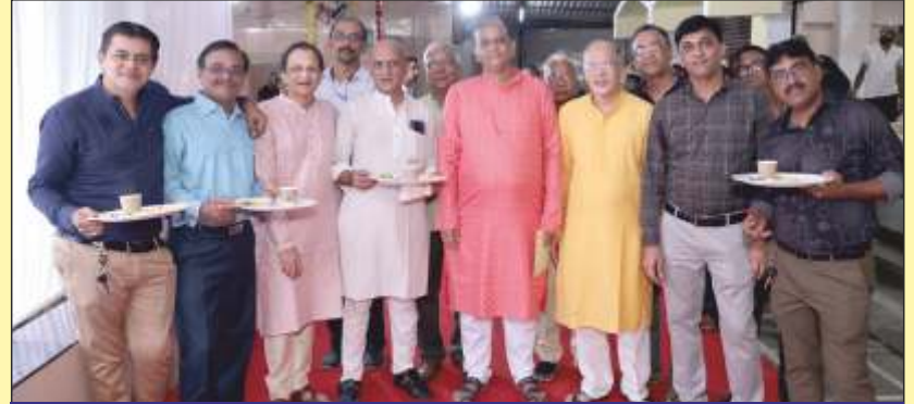
નવકારશીને ન્યાય આપતા હોદ્દાદારો, કારોબારી સભ્યો