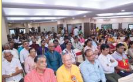
ભક્તિ રસ કાર્યક્રમ માણતા શ્રોતાગણ