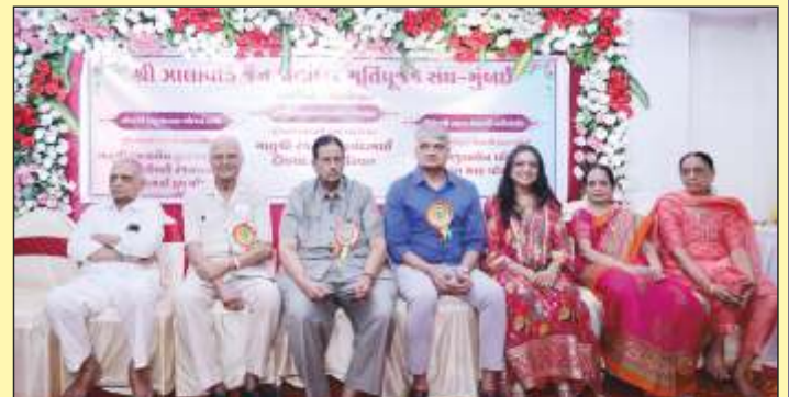
મંચસ્થ, લાભાર્થી પરિવાર અને, પ્રમુખશ્રી, આઈ.પી.પી.