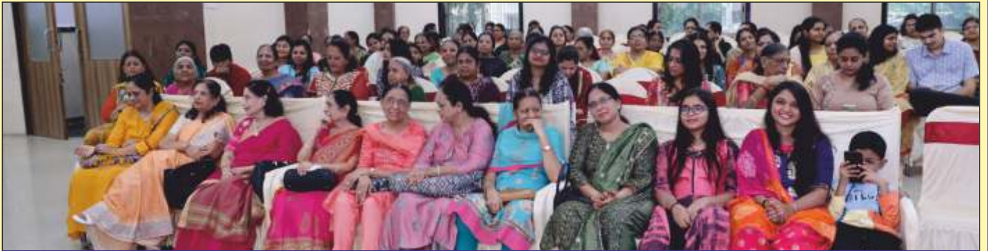
આમંત્રીત મહેમાનો, દાતા પરિવાર અને તપસ્વી બહેનો.